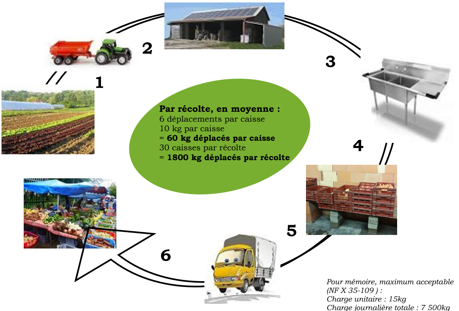
Schéma des déplacements d'une caisse de légumes du champ à la vente :

Contact : Biopousses 40 bis rue du 30 juillet 1944 - 50660 LINGREVILLE